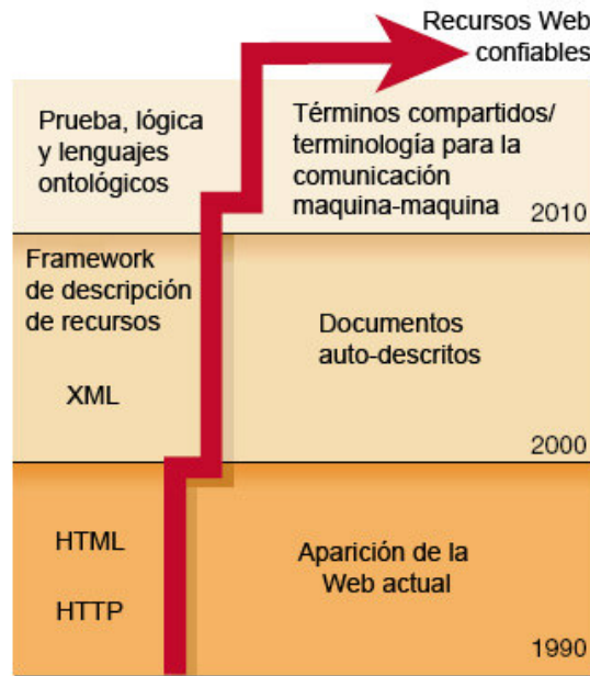
Fig. 1. Evolución de Web y tecnologías involucradas [2]